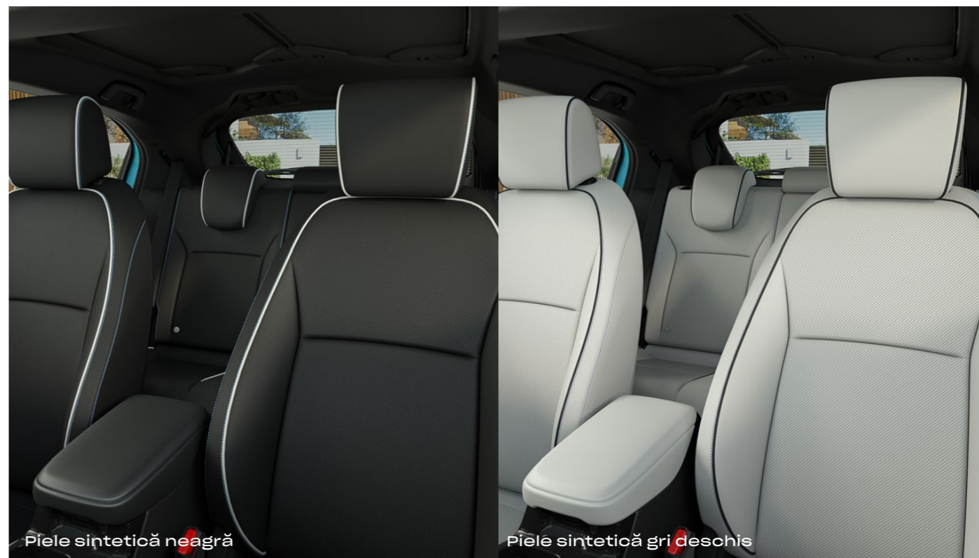
Piele sintetică neagră