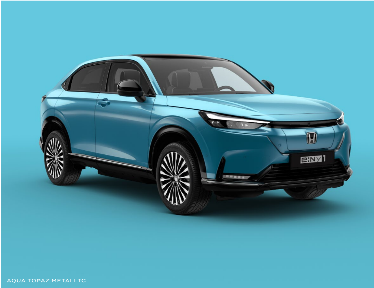
AQUA TOPAZ METALLIC

Alege dintr-o gamă de culori contemporane care reflectă personalitatea ta și stilul dinamic al noului e:Ny1.