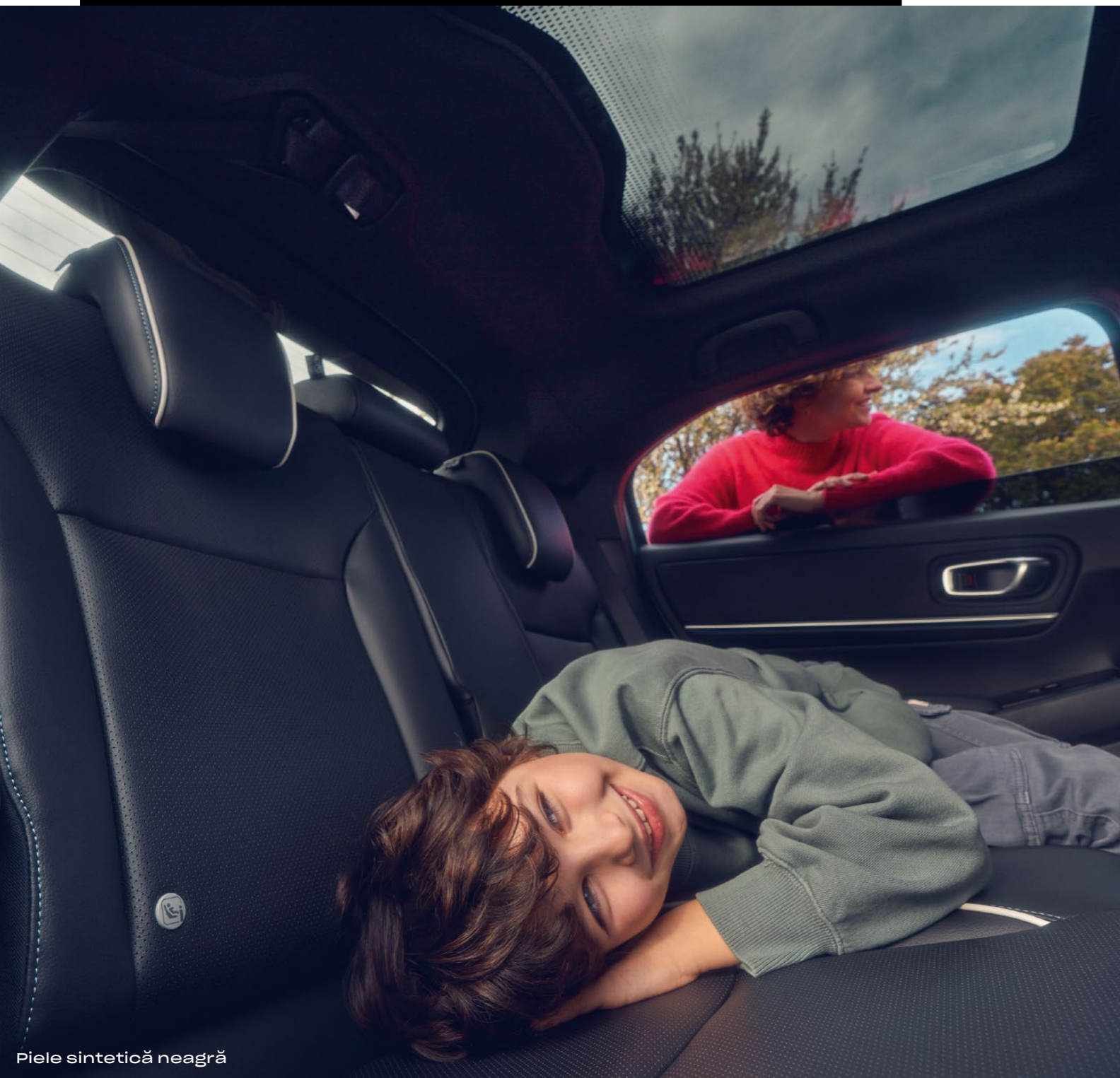
Piele sintetică neagră

*Disponibil pentru echipările și culorile selectate. Modelul din imagine este Honda e:Ny1, echiparea Advance, culoarea Aqua Topaz Metallic. Pentru mai multe informații asupra disponibilității acestor dotări, precum și a altora, te rugăm să consulți paginile de specificații 52-55.