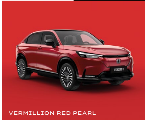
VERMILLION RED PEARL