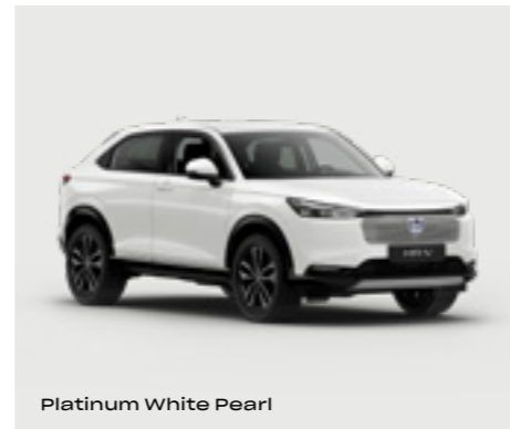
Platinum White Pearl