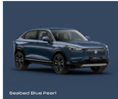
Seabed Blue Pearl