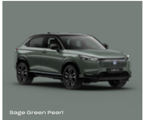
Sage Green Pearl