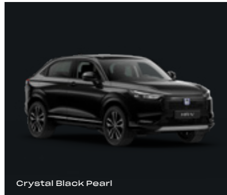
Crystal Black Pearl