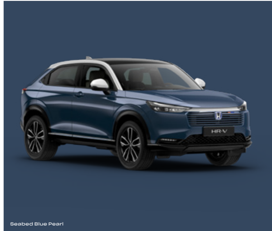
Seabed Blue Pearl