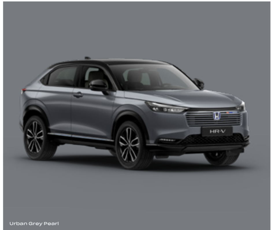
Urban Grey Pearl