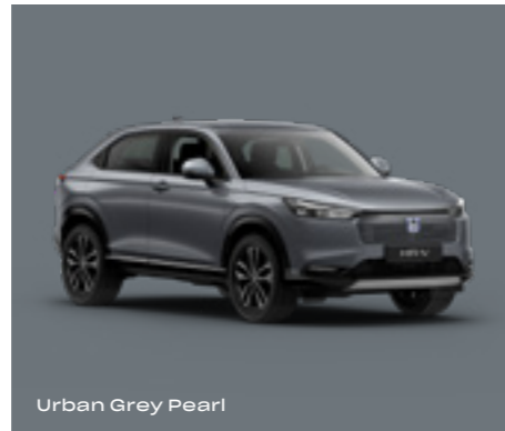
Urban Grey Pearl