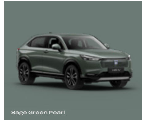
Sage Green Pearl