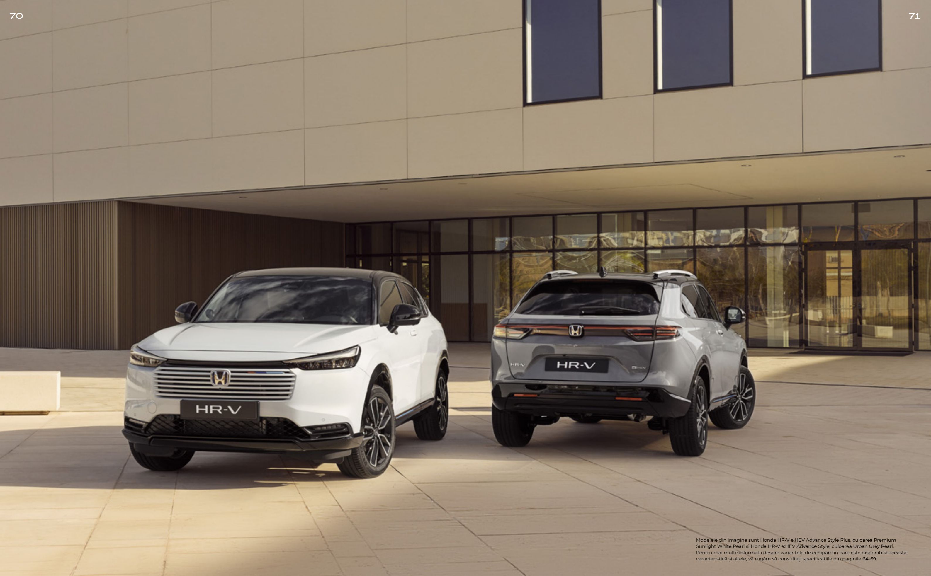
Modelele din imagine sunt Honda HR-V e:HEV Advance Style Plus, culoarea Premium Sunlight White Pearl și Honda HR-V e:HEV Advance Style, culoarea Urban Grey Pearl. Pentru mai multe informații despre variantele de echipare în care este disponibilă această caracteristică și altele, vă rugăm să consultați specificațiile din paginile 64-69.