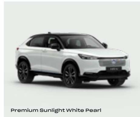
Premium Sunlight White Pearl