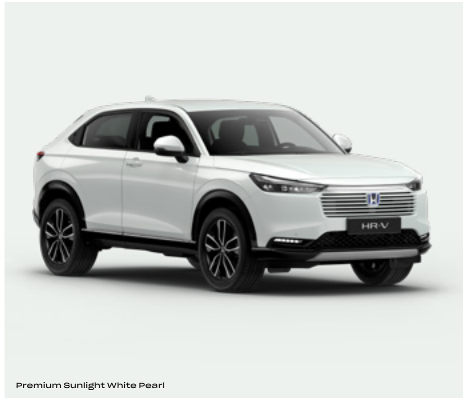
Premium Sunlight White Pearl