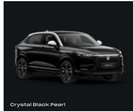
Crystal Black Pearl